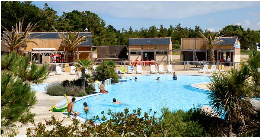
Villages de vacances